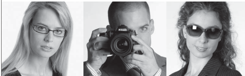
Foto - Digital - Video - Colorlabor - Passbilder - Rahmen - Fotoalben - Optik - Brillen - Contactlinsen - Fernrohre - Feldstecher - Teleskope

ZUG, BUNDESPLATZ 2 BAAR, DORFSTRASSE 12 WWW.FOTO-OPTIK-GRAU.CH